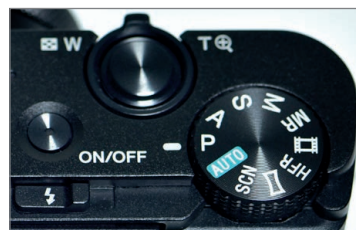
▲ Das Moduswahlrad, eingestellt auf Programmautomatik P.

Eine große Blende bedeutet eine kleine Blendenzahl und eine kleine Blende eine große Blendenzahl. Die benachbarten Werte einer Blendenreihe stehen, da sie sich auf den Durchmesser der Öffnung beziehen, immer im Verhältnis 1:1,4 (Wurzel aus 2), sodass sich die offene Fläche im Quadrat dieser Werte ändert. Schauen Sie einmal von vorn auf Ihr Objektiv: Die kleinste Blendenzahl bezeichnet auch die maximale Anfangslichtstärke Ihres Objektivs, zum Beispiel f/2.8 bei 70 mm Brennweite. Wenn Sie den Objektivring drehen, stehen alle Zahlenwerte, die nach dem Wert 2.8 im Display erscheinen (4.0, 5.6, 8.0), für entsprechend kleinere Blendenstufen.