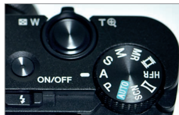
▲ Das Moduswahlrad, eingestellt auf Zeitautomatik A.